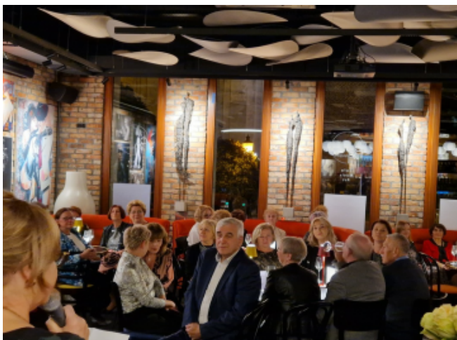
Minister Finansów Andrzej Domański

Mam nadzieję, że data 19 października na stałe wpisze się do kalendarza każdego Biegłego Rewidenta.